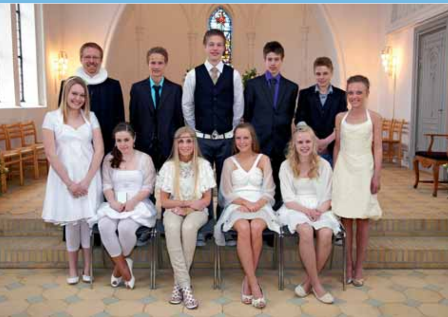
Dalbys konfirmander 2010 Se deres bøn side 4