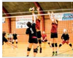
IDRÆT Fuld fart på volleysæsonen Læs side 8