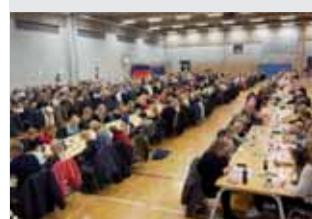
GANG I DIG OG DALBY Generalforsamlinger i Dalbys foreninger Læs side 2-3