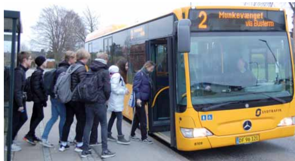
Ved denne afgang var der ni personer, der alle ville have taget bussen fra stoppestedet ved svinget på Engen / Gl. Tved. De måtte op på Idyl på grund af ruteomlægningen.

- Det her må være en ommer, og beslutninger må som minimum træffes på et faktisk korrekt grundlag og i øvrigt med hensyn til de kommunale ejede institutioner, siger hun.