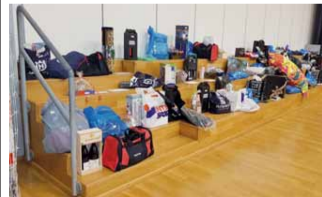
Disse præmier var med til at trække rigtig mange deltagere til Dalby Banko 2017, så Beboerforeningens bestyrelse efterfølgende kunne overføre 4500 kr. til initiativgruppen bag Banko Torv.

løb, og da der var udsolgt af lodder, kunne Beboerforeningen sende 4500 kroner videre til Dalby Torv projektet. Projektgruppen for Dalby Torv er meget taknemmelige over beboerforeningens engagement.