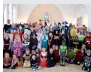
KIRKE Fastelavn for hele familien Læs side 5