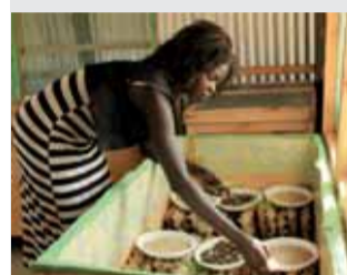
KIRKE Sogneindsamling for Folkekirkens Nødhjælp Læs side 4