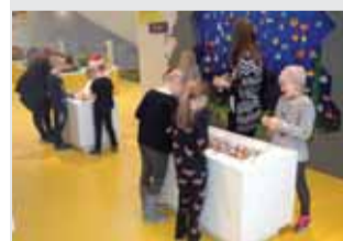
SKOLE 1.B på besøg i Lego House Læs side 7