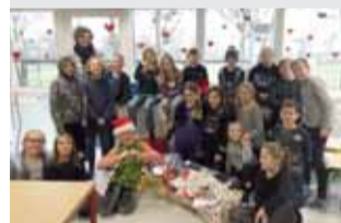
SKOLE Børn hjælper børn i julen Læs side 6